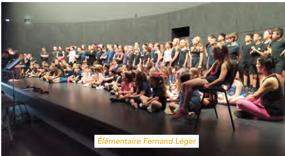
Élémentaire Fernand Léger