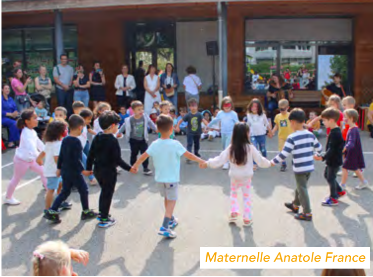
Maternelle Anatole France