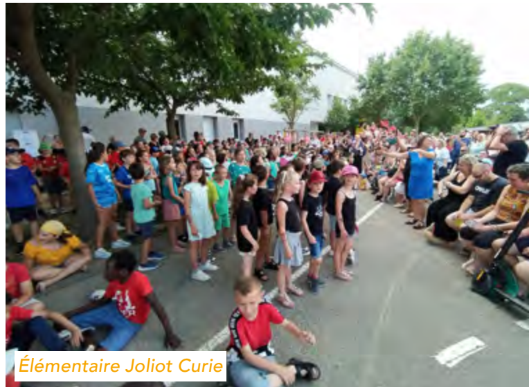
Élémentaire Joliot Curie